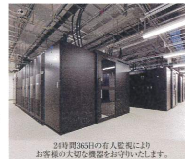
24時間365日の有人監視により お客様の大切な機器をお守りいたします。

ハウジングサービス ラックで御社の機器をお預かり ホスティングサービス 御社の機器を弊社でご用意 データエントリーサービス 御社の紙情報をCSVや テキスト(TXT)形式へデータ化 ● 高密度サーバーに対応したラック ● UPS設備