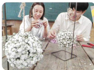
1個を1名~2名で作るイメージです

6.21(金) 10:00受付・定員10名 【所要時間2時間】 1個 2,500円