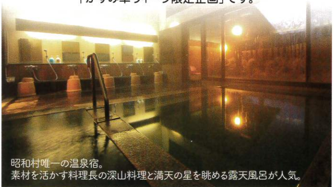
昭和村唯一の温泉宿。 素材を活かす料理長の深山料理と満天の星を眺める露天風呂が人気。

「スタンド作り」「ミニランプシェード作り」どちらかチョイス可 「かすみ草ウィーク限定企画」です。